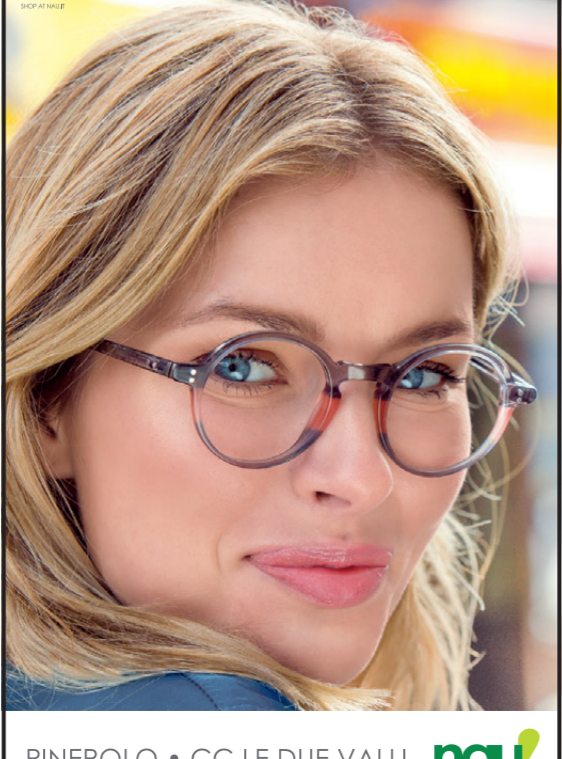
PINEROLO • CC LE DUE VALLI nau