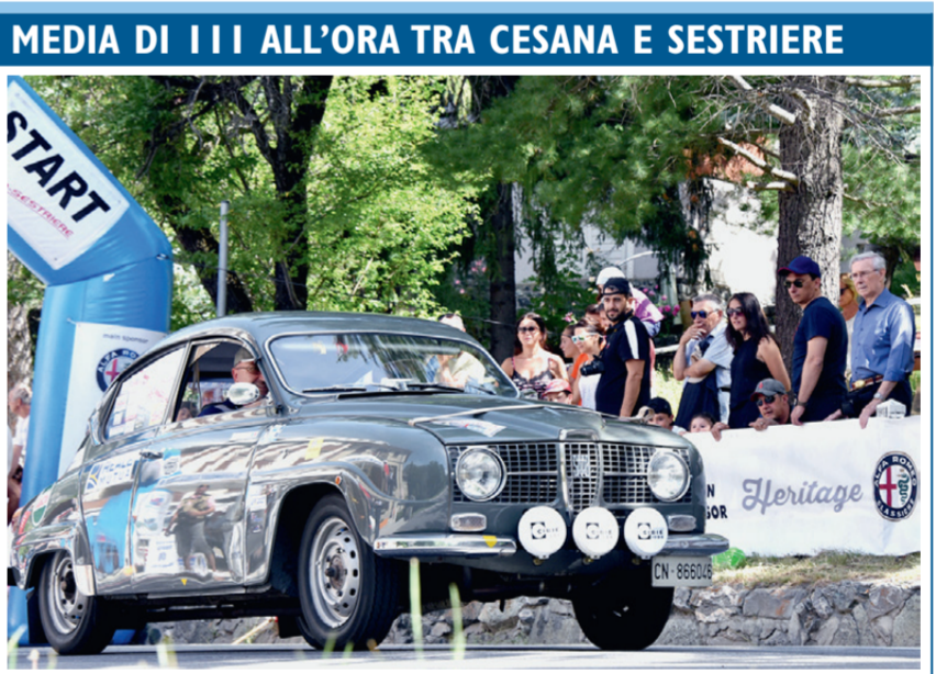
La 36ª edizione della Cesana-Sestriere va al lombardo Emanuele Allara, che sotto la pioggia conquista per la prima volta la prestigiosa kermesse al volante della sua monoposto Dallara F390, battendo il favorito Umberto Bonucci, per pochi decimi di secondo. In foto una splendida auto d'epoca.