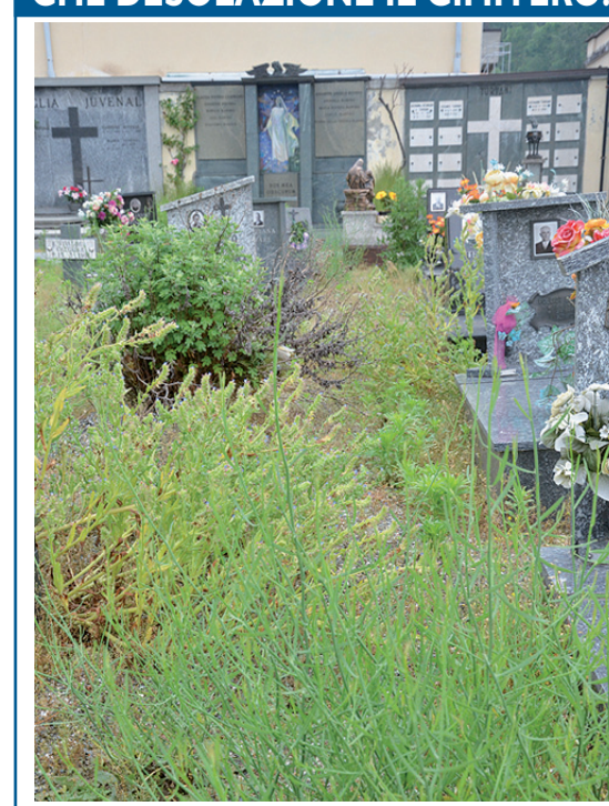
Si presentava così, desolato e trascurato, venerdì scorso, il cimitero di Pinerolo. Erba alta e infestante tra una tomba e l'altra, nei viali centrali e nei passaggi comuni. Sarà che i morti non si lamentano...