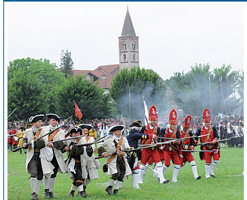
REVELLO - La rievocazione storica della Battaglia di Staffarda ha avuto uno straordinario successo di pubblico, con la partecipazione di gruppi da tutta la regione.