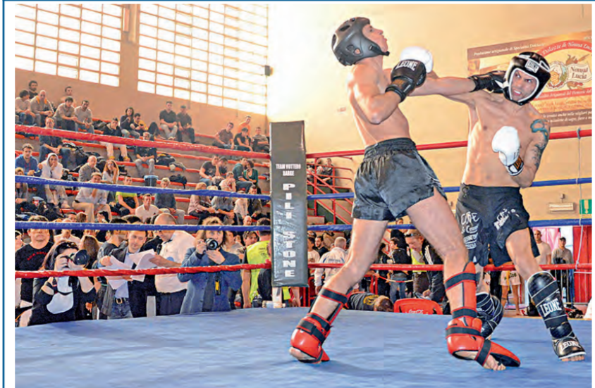
Spalti gremiti al palazzetto dello sport di Pinerolo per il Campionato regionale di kick-boxing, che domenica pomeriggio ha visto competere oltre 250 atleti, donne e uomini, provenienti da Piemonte, Lombardia e Liguria. Una disciplina in ascesa, il cui feeling con il ring pinerolese continua a crescere, come dimostra il giovane pubblico, composto da appassionati, ma anche da curiosi.