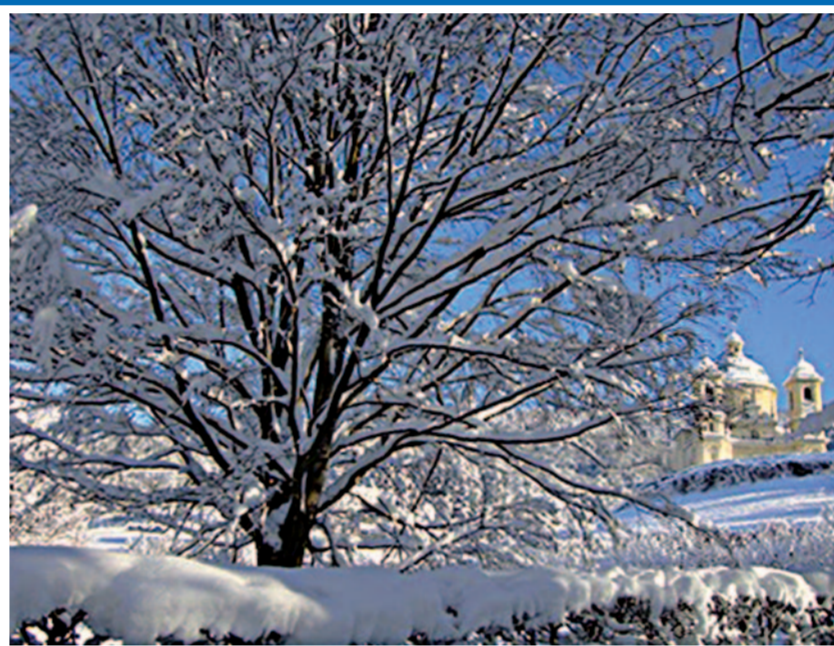
È stata la nevicata più intensa dell'inverno (a Pinerolo liberare le strade è costato 20mila euro) quella che, nei giorni scorsi, ha investito pianura e valli (70 centimetri a Bobbio e Pragelato, una novantina a Sestriere). Un nostro lettore l'ha documentata a Villar Perosa (sullo sfondo S. Pietro in Vincoli).