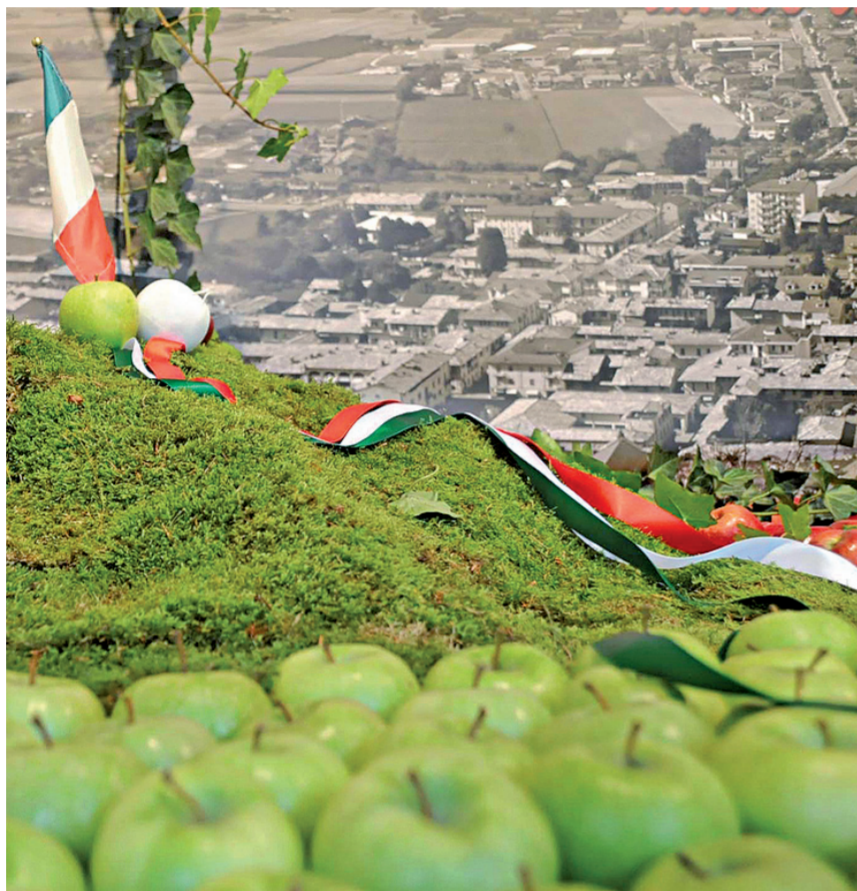
CAVOUR - Cavour non nasconde le sue virtù e usa tutte le strategie per far parlare di sé... Così ripropone la Rocca mignon in mezzo ad una distesa di mele tricolori: una visione surreale e creativa, quella che offre il plastico esposto a Tuttomele. E si fa guardare come la rotonda di Gomerello: una porta (quella sulla Sp 589) che richiama il territorio in miniatura, tra frutta matura tutto l'anno e una mucca di resina... per far sussultare gli automobilisti in marcia (!).

Le feste ai piedi della Rocca volano per l'economia del territorio