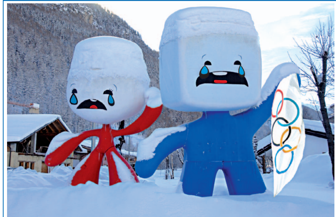
Le mascotte Neve e Gliz, quattro anni dopo. Danno ancora il benvenuto sulla rotonda d'ingresso a Pragelato, proprio come nei giorni dei XX Giochi olimpici invernali di Torino 2006. Ma a guardarli meglio, la palla di neve e il cubetto di ghiaccio, forse riuscirete a vederli le lacrime. Sarà per la nostalgia di quel mese da star, con tutti i riflettori puntati sugli atleti e sugli impianti nuovi di pacca. O forse sarà il rimpianto (e a Pragelato non manca) per ciò che il 2006 avrebbe potuto lasciare. E invece. Sull'anello olimpico del fondo le magie di Di Centa sono una foto già sbiadita. I Mondiali di sci nordico 2013, per dire, se li è soffiati la Val di Fiemme. Ora è praticamente una pista turistica. Sui trampolini, nemmeno un salto. Solo qualche sciatore incosciente che provoca il distacco di slavine, nonostante i cartelli "Vietato l'accesso". E l'ultimo scandalo (documentato da "LECO" sullo scorso numero) all'hotel sotto le tribune: gran parte dei tubi danneggiati dal gelo perché nessuno pagava più il riscaldamento, senza atleti da ospitare. Almeno finora.

IL PIANTO A DIROTTO DI NEVE E GLIZ A PRAGELATO