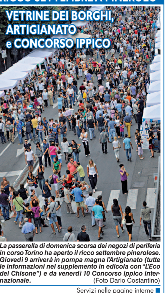
La passerella di domenica scorsa dei negozi di periferia in corso Torino ha aperto il ricco settembre pinerolese. Giovedì 9 arriverà in pompa magna l'Artigianato (tutte le informazioni nel supplemento in edicola con "L'Eco del Chisone") e da venerdì 10 Concorso ippico internazionale.