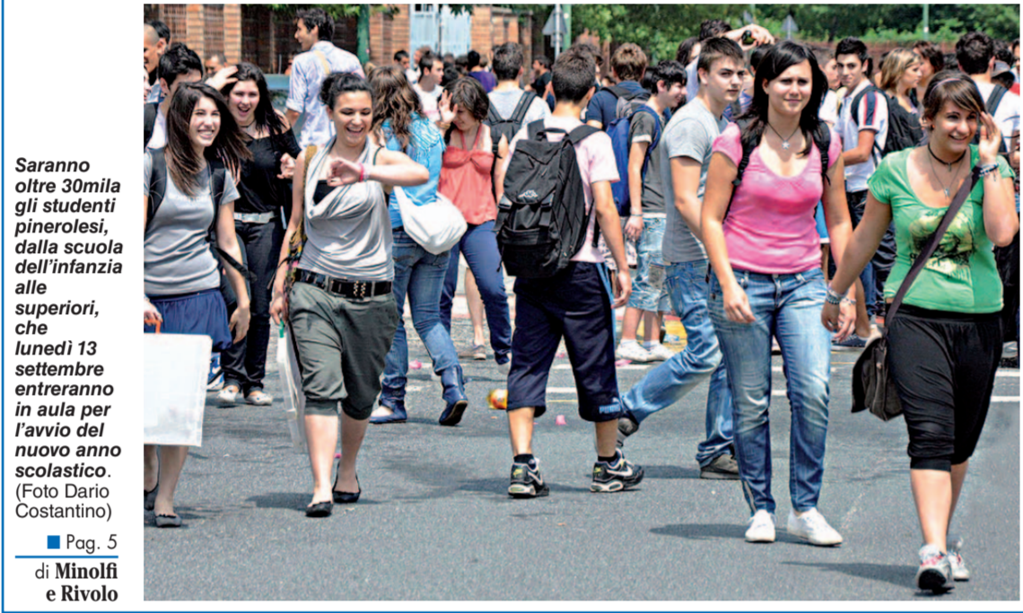
Saranno oltre 30mila gli studenti pinerolesi, dalla scuola dell'infanzia alle superiori, che lunedì 13 settembre entreranno in aula per l'avvio del nuovo anno scolastico.