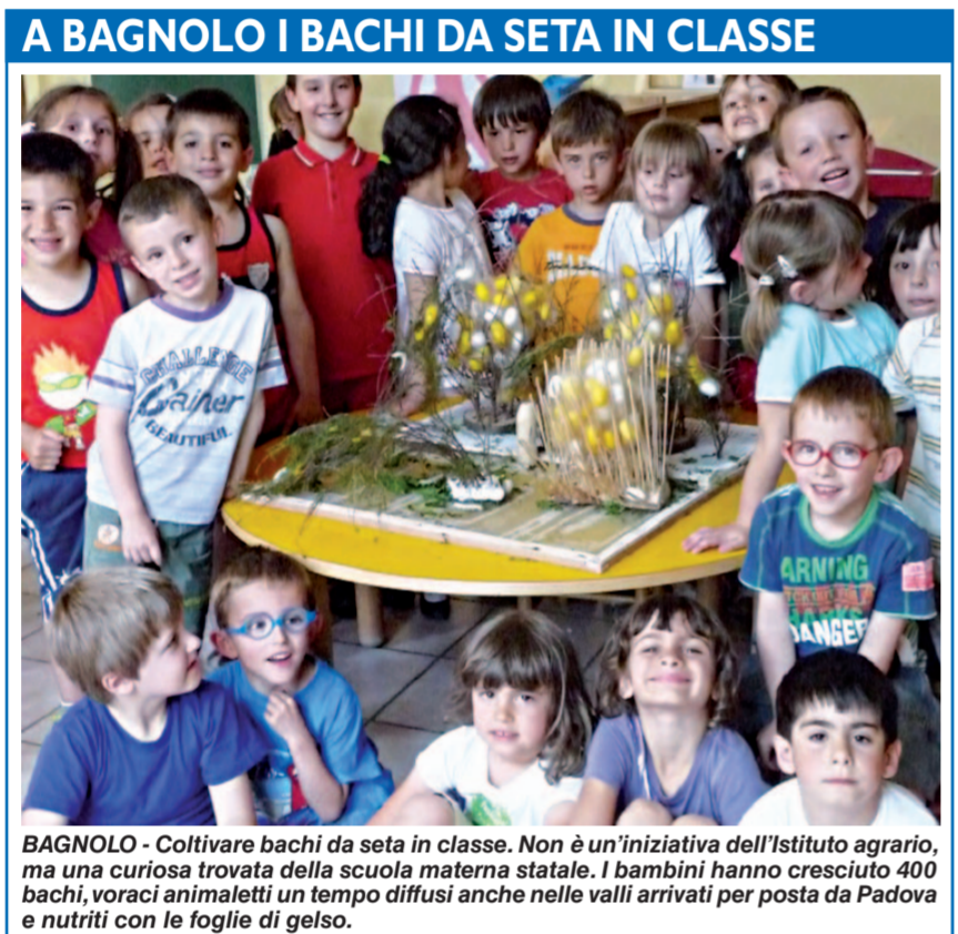
A BAGNOLO I BACCHI DA SETA IN CLASSE BAGNOLO - Coltivare bacchi da seta in classe. Non è un'iniziativa dell'Istituto agrario, ma una curiosa trovata della scuola materna statale. I bambini hanno cresciuto 400 bacchi, voraci animaletti un tempo diffusi anche nelle valli arrivate per posta da Padova e nutriti con le foglie di gelso.

Per i ciclisti arriva invece la polizza furto pagata dalla Provincia