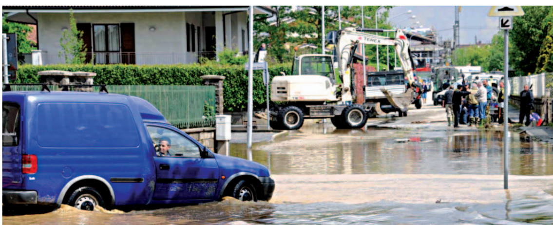
VILLAFRANCA - Un vero diluvio: è quello che si è abbattuto la sera di mercoledì 5 maggio sulle campagne di Cavour, Villafranca, Cardè, Moretta. Quaranta minuti di inferno: acqua e grandine. Il mattino dopo non restava che contare i danni e liberare case e strade.

È venuto giù il cielo, mercoledì 5 maggio. A Villafranca, soprattutto, ma anche a Cardè, Moretta, Cavour. Poco più di 40 terribili minuti: un nubifragio violentissimo, che ha scaricato 20 cm di grandine e un'impressionante quantità di acqua. Da subito chi ha avuto le case allagate si è messo all'opera per salvare il salvabile. Dal giorno dopo si è cominciato a contare i danni. Qualche allagamento con intervento dei Vigili del fuoco anche a Barge e Bagnolo, ma la situazione più grave (seppur già rientrata) si è registrata a Staffarda, dove ha ceduto un muro di sostegno del canale del Molino nel complesso abbaziale. Piogge violente che non hanno mancato di suscitare un'ondata di polemiche: da Villafranca per interventi di messa in sicurezza promessi ma mai eseguiti, a Castagnole dove il sindaco Filippa lancia l'allarme: «Servono interventi urgenti, ci hanno dimenticati». Una buona notizia arriva da S. Secondo, dove lunedì sera è stato presentato un progetto (già finanziato) per la messa in sicurezza del Chisone a Miradolo e Pinerolo, area Cardonata. Pagine interne di Chiarenza, Lorenzati, Battisti, Groppo, Miè, Vaglianti