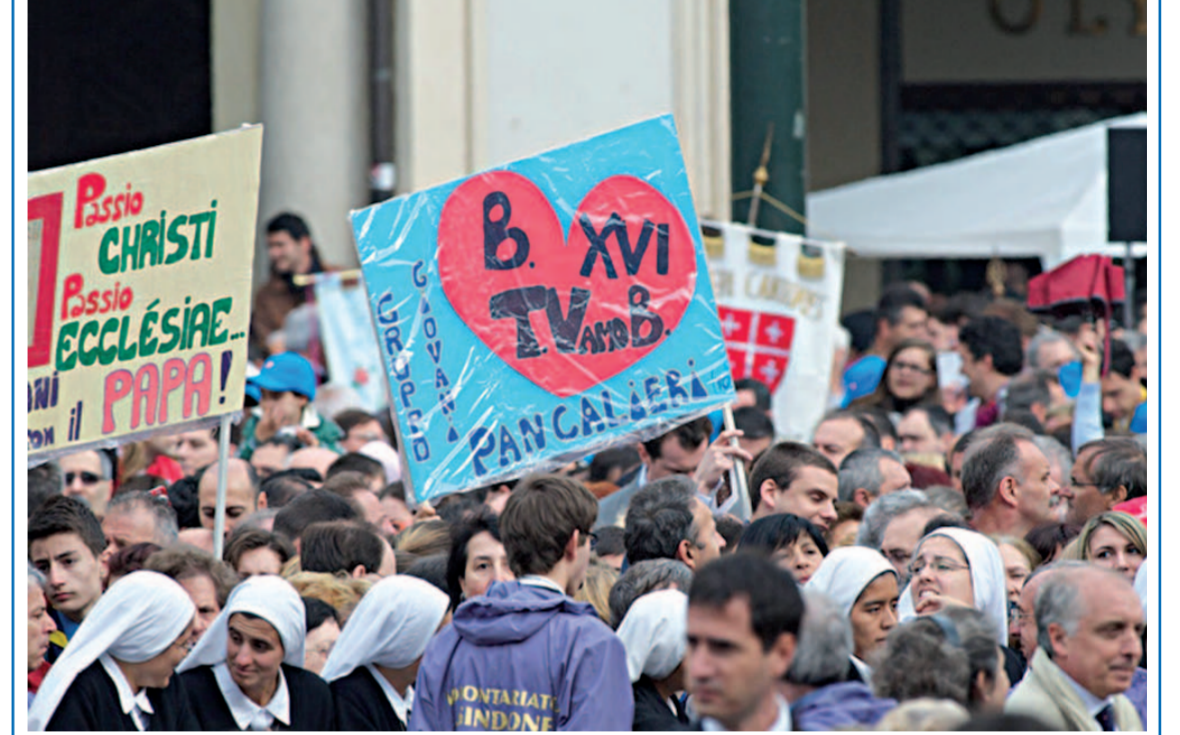
Non è mancato l'apporto del Pinerolese all'incontro con il Papa a Torino. In ordine sparso si sono visti i cartelli di numerose parrocchie: Vigone, Cerenasco, Cavour, Pancalieri ecc., mentre dalla Diocesi di Pinerolo sono stati oltre 150 i giovani che hanno preso parte all'incontro pomeridiano con Benedetto XVI.