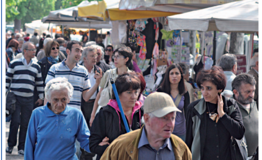
PINEROLO - Folla delle grandi occasioni lunedì scorso per la Fiera d'aprile a Pinerolo. Non saranno più i tempi d'oro di vent'anni fa, quando per gli ambulanti costituiva una piazza da non perdere, ma - complice anche il bel tempo - in molti non hanno rinunciato a una passeggiata (con qualche acquisto) tra le bancarelle del centro o alla mostra-mercato del bestiame e delle macchine agricole in piazza d'Armi.