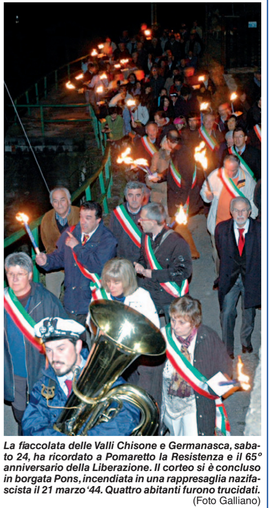
La fiaccolata delle Valli Chisone e Germanasca, sabato 24, ha ricordato a Pomaretto la Resistenza e il 65° anniversario della Liberazione. Il corteo si è concluso in borgata Pons, incendiata in una rappresaglia nazifascista il 21 marzo '44. Quattro abitanti furono trucidati.