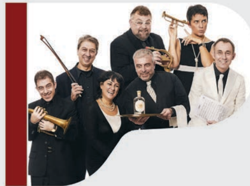
Voci di corridoio

Musica swing e melodie e ritmi del passato