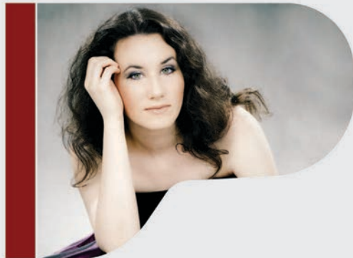
Martina Filjak pianoforte